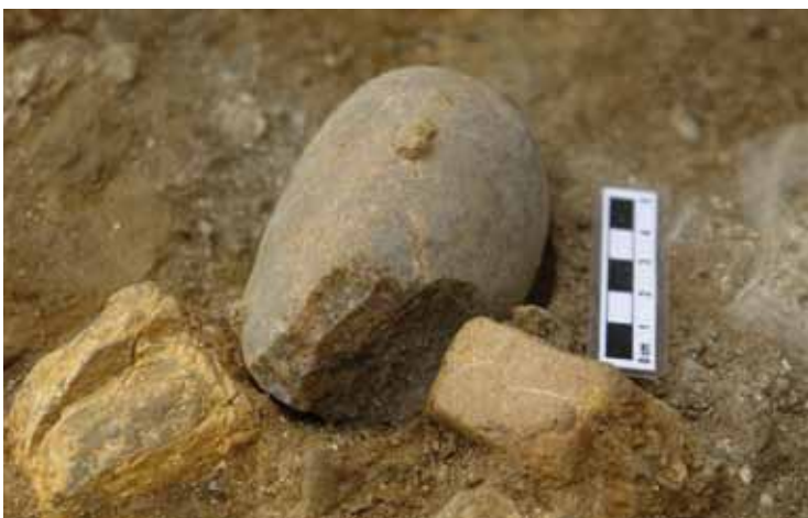
•Eines de pedra d'un milió d'anys que s'han posat al descobert durant el juny

L'elaboració d'aquest pla director, en el que estan treballant de forma conjunta l'Ajuntament i l'IPHES a parts iguals, ja es troba en un estat força avançat i es podrà presentar la pròxima tardor.