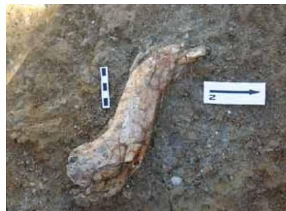
• Una de les restes de fauna pendents d'identificar

Aquest any també s'ha intervingut al jaciment de la Mina, que s'ha netejat després que una esllavissada tapés el sondeig efectuat en altres campanyes. "De forma manual, durant les dues primeres setmanes, vam retirar més de 15 metres cúbics de terra esponjada i posteriorment s'ha excavat la superfície del sondeig", explica Vallverdú.