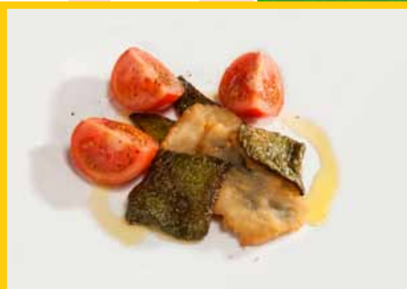
Seitó en tempura

Seitó en tempura en un llit de pebrot verd i tomàquet natural.