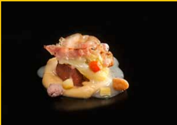
Ara toca carn d'olla