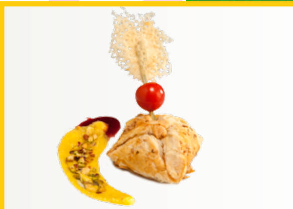
Farcellet cruixent de llom al Pedro Ximénez

Llom “solomillo”, amb melmelada de tomàquet, mango, formatge de cabra ceba i Pedro Ximénez