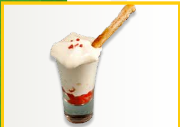
Mouse de brandada de bacallà a l'estil Chefchu