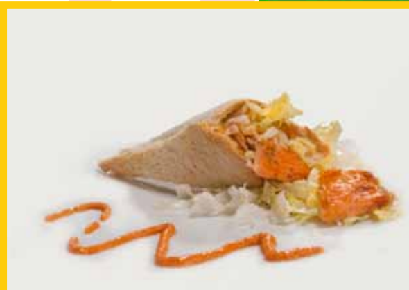
Cucurucho de abril

Cucurull de pa torrat farcit d'escarola, tonyina, bacallà esqueixat, encenalls de poma i salmó al forn regat amb salsa de la mama