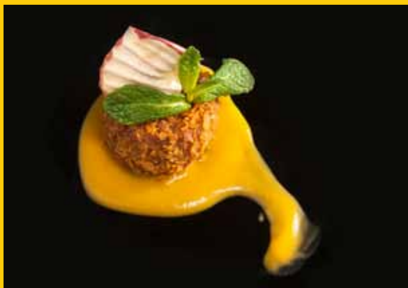
Medalló d'arepa colombiana sobre crema de carbassa

Carn picada de vedella, sobre una salsa casolana amb un toc de cereals.