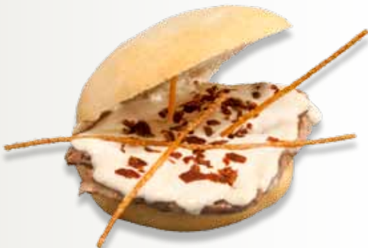
Mollete lombo tonnato