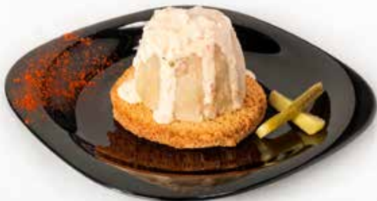
Volcà en erupció

Puré de patata i tonyina, banyat en salsa de l'Àvia sobre una base de pa torrat