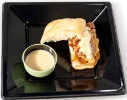
El secret de Carmen & CIA

Secret marinat amb mostassa amb pa focaccia, crema gorgonzola, ceba i compota de pomes