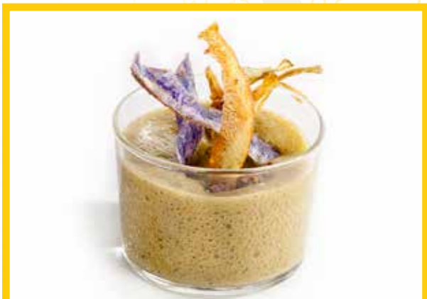
Calçotada com a casa