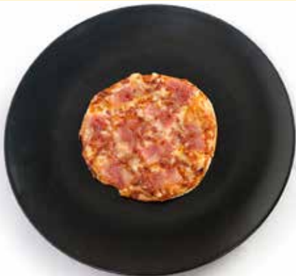
Pizza especial barbacoa